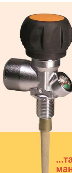
...также с манометром