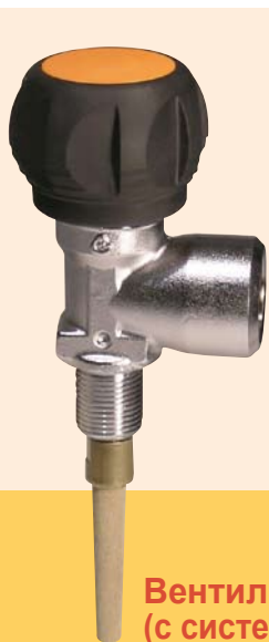
Вентиль с маховиком ACS (с системой анти-закрытия)